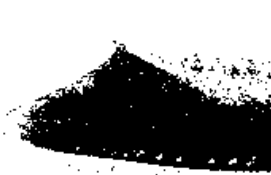
丝绸之路上的商队

2. 某历史兴趣小组进行研究性学习，搜集到一些资料。下面这一组图片资料体现的主题是（ ）