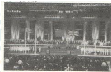
中英香港政权交接仪式