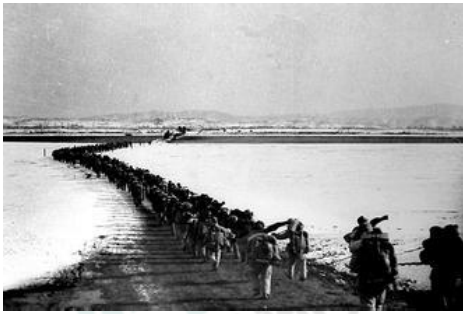
图一 中国人民志愿军跨过鸭绿江