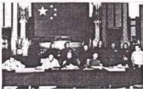
图一 《关于西藏和平解放的协议》签字仪式