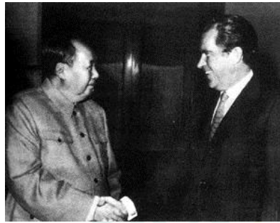
图二 毛泽东会见尼克松