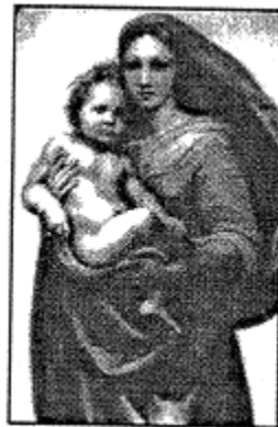
拉斐尔的《西斯廷圣母》