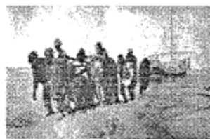
C. 《伏尔加河上的纤夫》