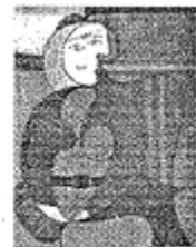
D. 《坐在椅子上的女人》