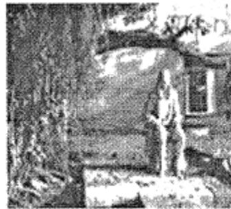
图2 牛顿思考苹果落地的原因

材料二 启蒙运动的意识形态倾向于把自然哲学家变成英雄，而在法国最伟大的英雄是牛顿……在法国人如伏尔泰和孟德斯鸠的心目中，英国是自由思想和意志自由之源，不过这也是因为他解开了行星之谜，说明它们的运动遵循着与地上运动相同的规律。