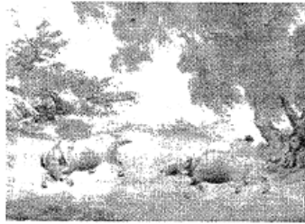
图 1: (南宋) 李迪《风雨归牧图》