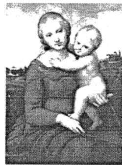
图 4: 拉斐尔《圣母子》