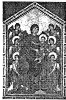
图 3:《庄严的圣母》1290 年