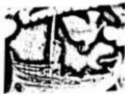
图三 《荷马史诗》相传为盲诗人荷马在民间口头文学的基础上加工整理而成。（图为《奥德赛》故事版画）