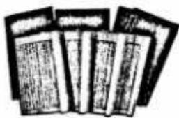
图二 鲁迅曾评价《史记》：“史家之绝唱，无韵之离骚。”（图为《史记》书影）