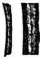
图一 记有日食的甲骨文