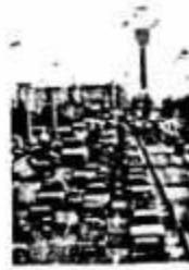
20世纪90年代的中国城市街头

材料二 1978—2007年我国城市人均住宅建筑面积由 6.7\text{m}^2 增加到 27.1\text{m}^2 , 城市建成区面积由1981年的 7438\text{km}^2 扩展到2005年的 32520.7\text{km}^2 , 我国城市人口也从1980年的19.6%快速跃到2005年的40.5%。