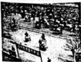
20世纪50年代前的中国城市街头