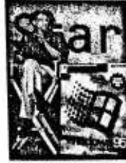
比尔·盖茨和微软品牌