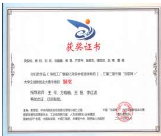
第三届中国“互联网+”大学生创新创业大赛全国铜奖