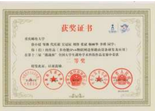
第十三届“挑战杯”全国大学生课外学术科技作品竞赛全国二等奖