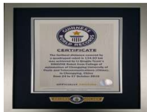
吉尼斯世界纪录认证