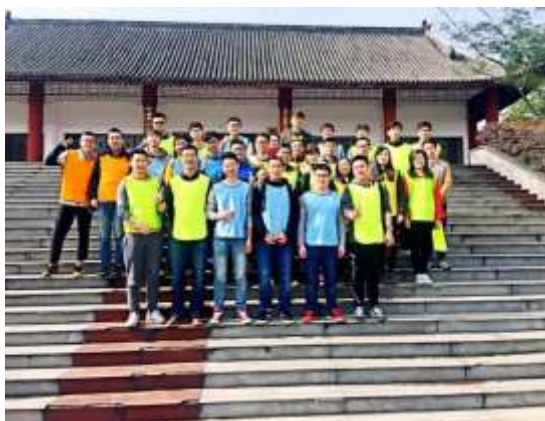
研究生素质拓展活动