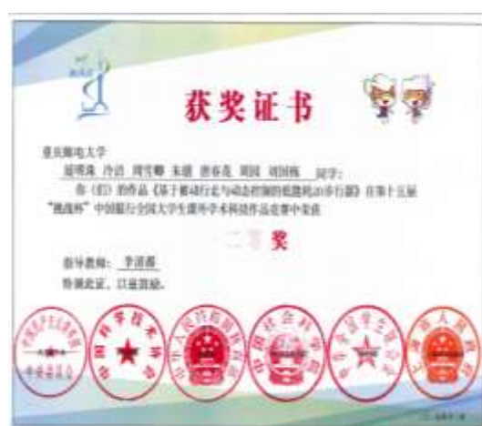
第十五届“挑战杯”全国大学生课外学术科技作品竞赛全国二等奖