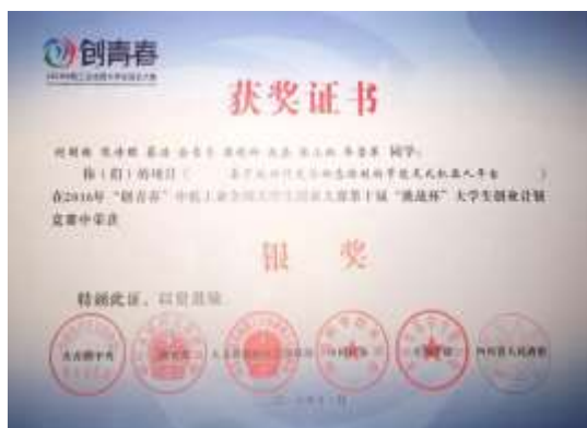
第十届“挑战杯”大学生创业计划竞赛全国银奖