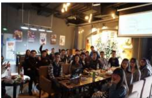
优秀毕业生干部交流会