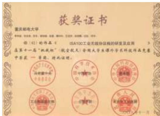
第十一届“挑战杯”全国大学生课外学术科技作品竞赛全国一等奖