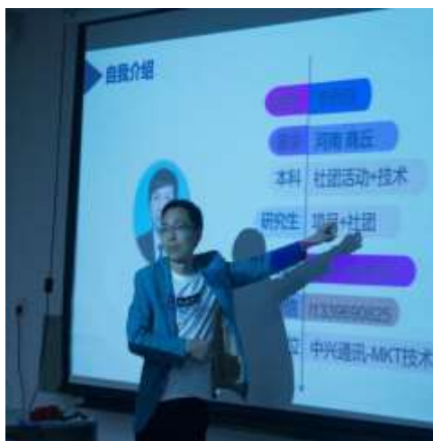
优秀毕业生交流经验