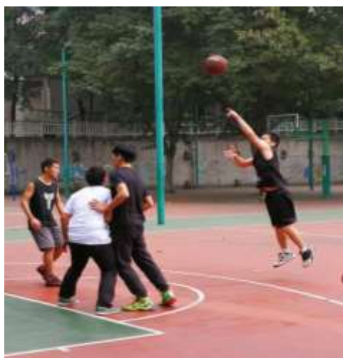
激情四燃的篮球赛交流会