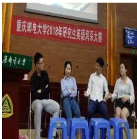
英语风采大赛决赛现场