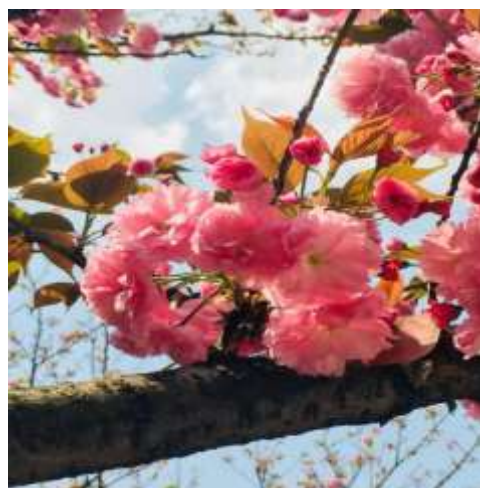
“影动重邮” 摄影大赛