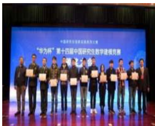
研究生参加科技竞赛获奖