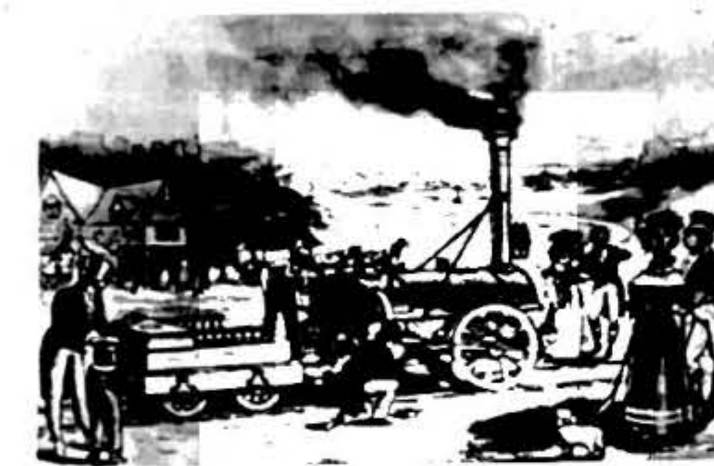
图二 1825年斯蒂芬森试验蒸汽机车