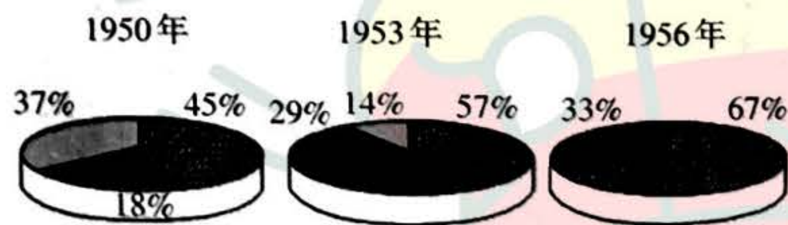
图例 ■ 社会主义工业 ■ 国家资本主义工业(由国家掌握) ■ 资本主义工业(自产自销)