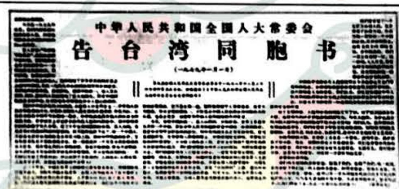
1979年元旦,全国人大常委会发表《告台湾同胞书》

一开始英方说,英中关于香港回归的协议上,只说1997年7月1日香港主权回归中国,并没有规定几分几秒的具体什么时间。而中方则据理力争,说7月1日就是从零时零分零秒开始的。 ——《为回归较量到最后一秒》