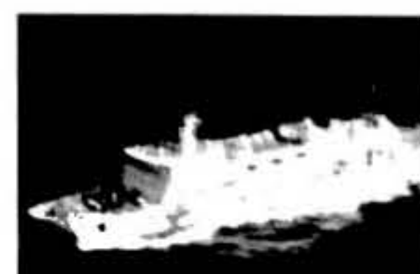
“和平方舟”号医院船