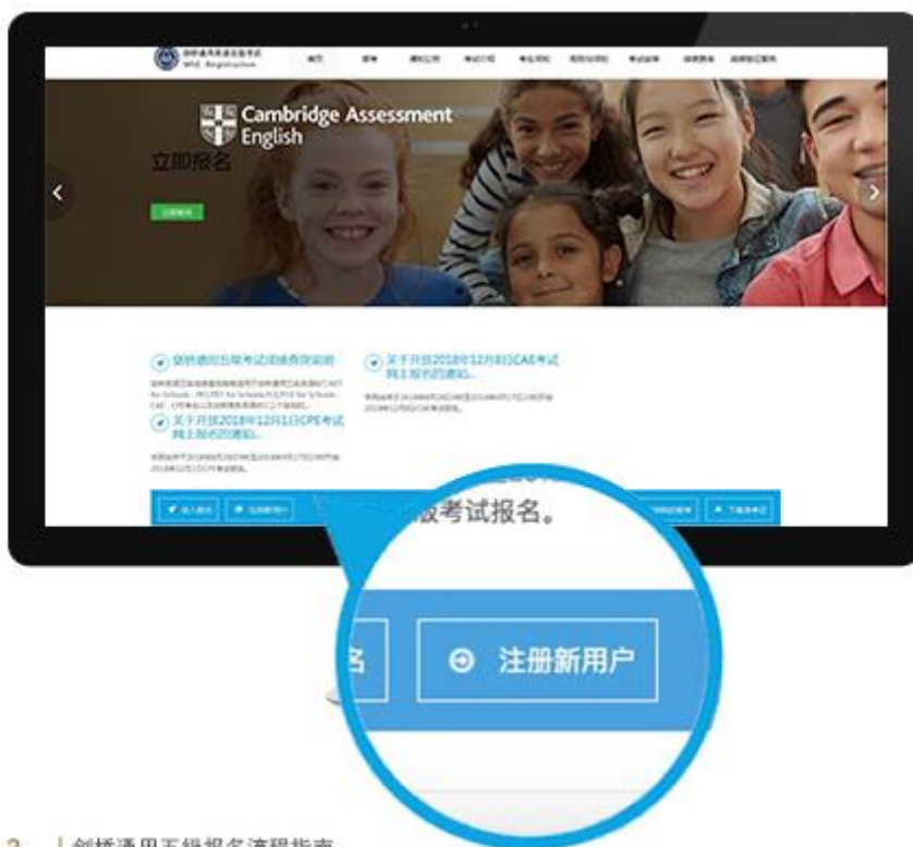
2 | 剑桥通用五级报名流程指南