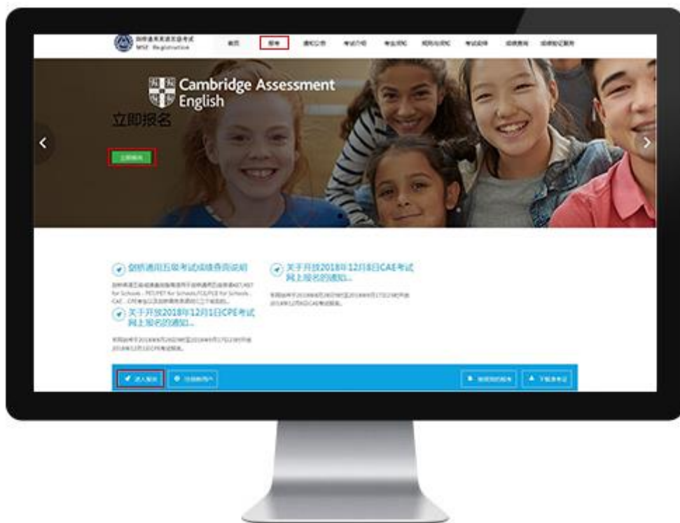
5 | 剑桥通用五级报名流程指南