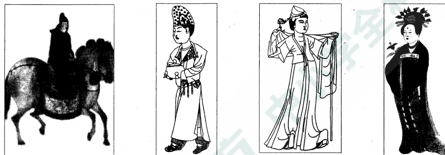
《虢国夫人游春图》中男装女子 戴胡帽穿胡服的女子 穿半臂长裙披帛的女子 穿广袖高腰裙的女子

材料二 女皇武则天的主政极大的促进了女权主义的兴起,女性自我表现意识增强。唐代前期妇女发明了一种“间色裙”,多种色彩相间,对比强烈,往往以红绿、红黄、红蓝为搭配,看起来活泼大方。