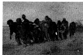
B. 《伏尔加河上的纤夫》