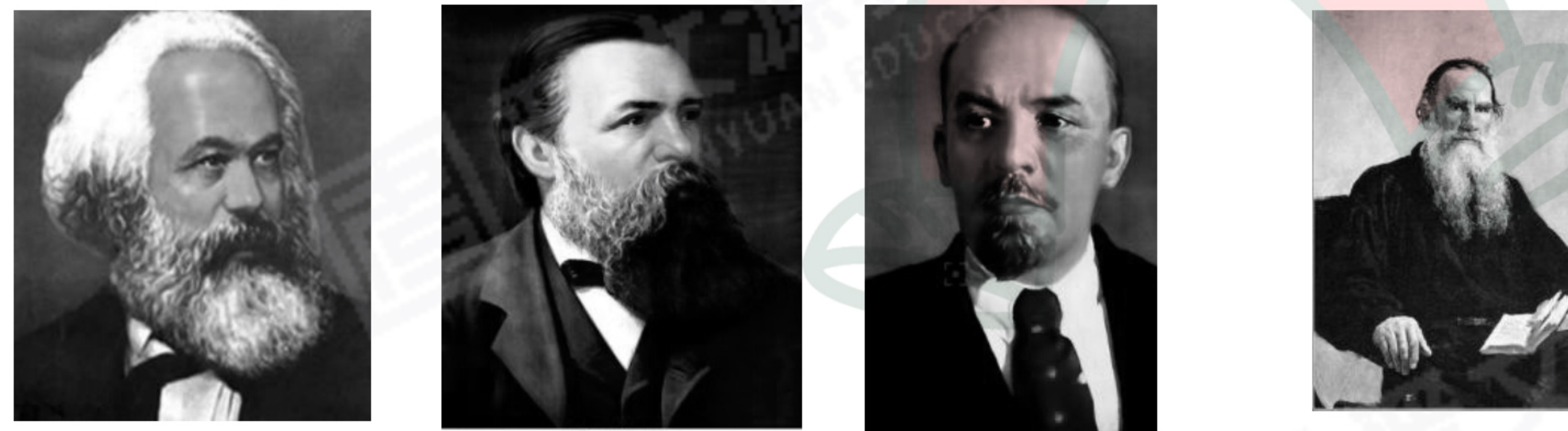
A. 马克思 B. 恩格斯 C. 列宁 D. 托尔斯泰

11. 作为一名共产主义思想家, 他创造性地将实践引入了哲学范畴, 在黑格尔辩证法的基础上发展了唯物主义, 而他所著的《资本论》又在政治经济领域产生了震古烁今的影响。这位思想家是