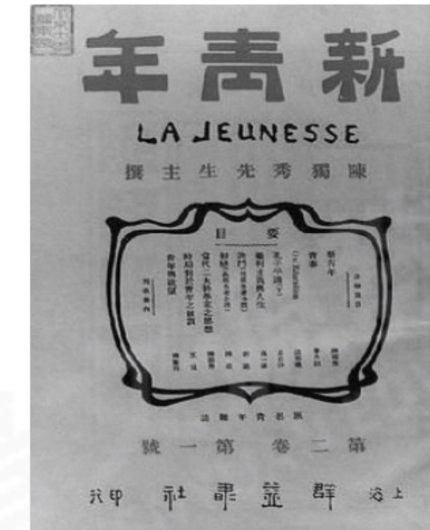
图一 陈独秀创办的《新青年》