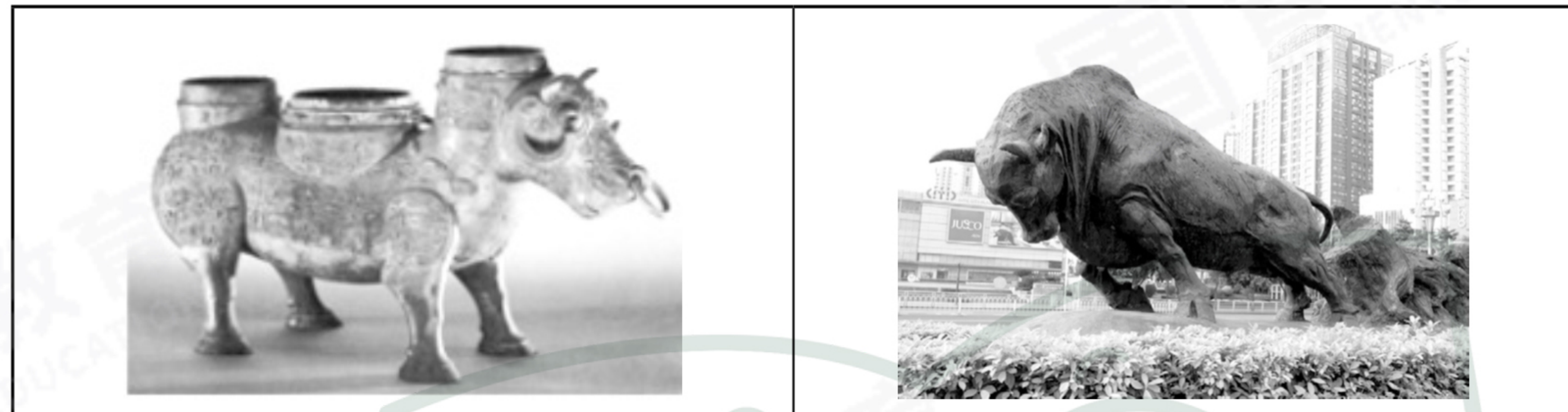
图一: 1923年在山西浑源李峪村出土,春秋战国时期的“牛鼻穿孔铜牛尊”,其牛鼻穿孔,戴环,这被认为是牛作为畜力被役使的实物见证。

(1)【实物解读】解读图一牛尊所反映的社会风貌及图二“拓荒牛”的精神内涵。(3分)