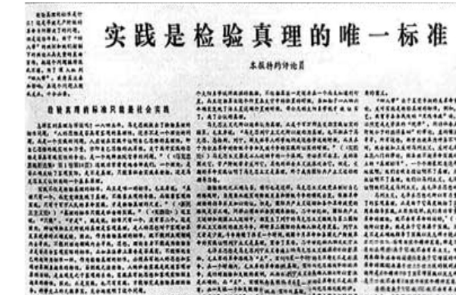
图二 1978年5月11日《光明日报》发表文章