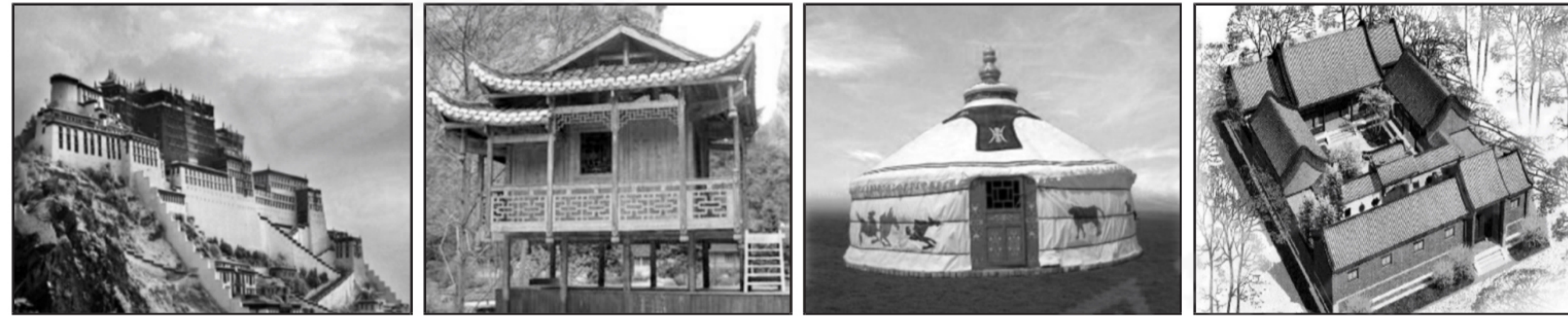
① _____ ②土家族 吊脚楼 ③ _____ ④汉族 四合院