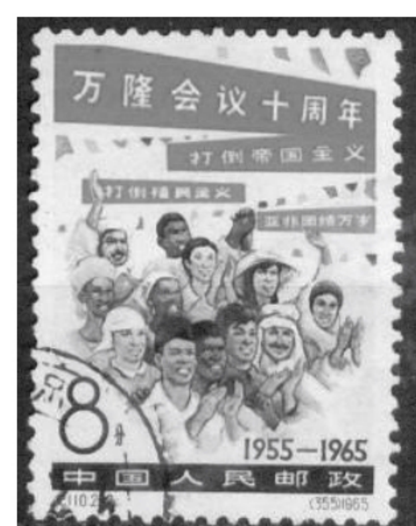
图三 《万隆会议十周年》纪念邮票

(3)【国际合作】国际合作是社会进步的助推器。结合史实,分别简述国家邮政总局发行下面两枚纪念邮票的理由。(4分)