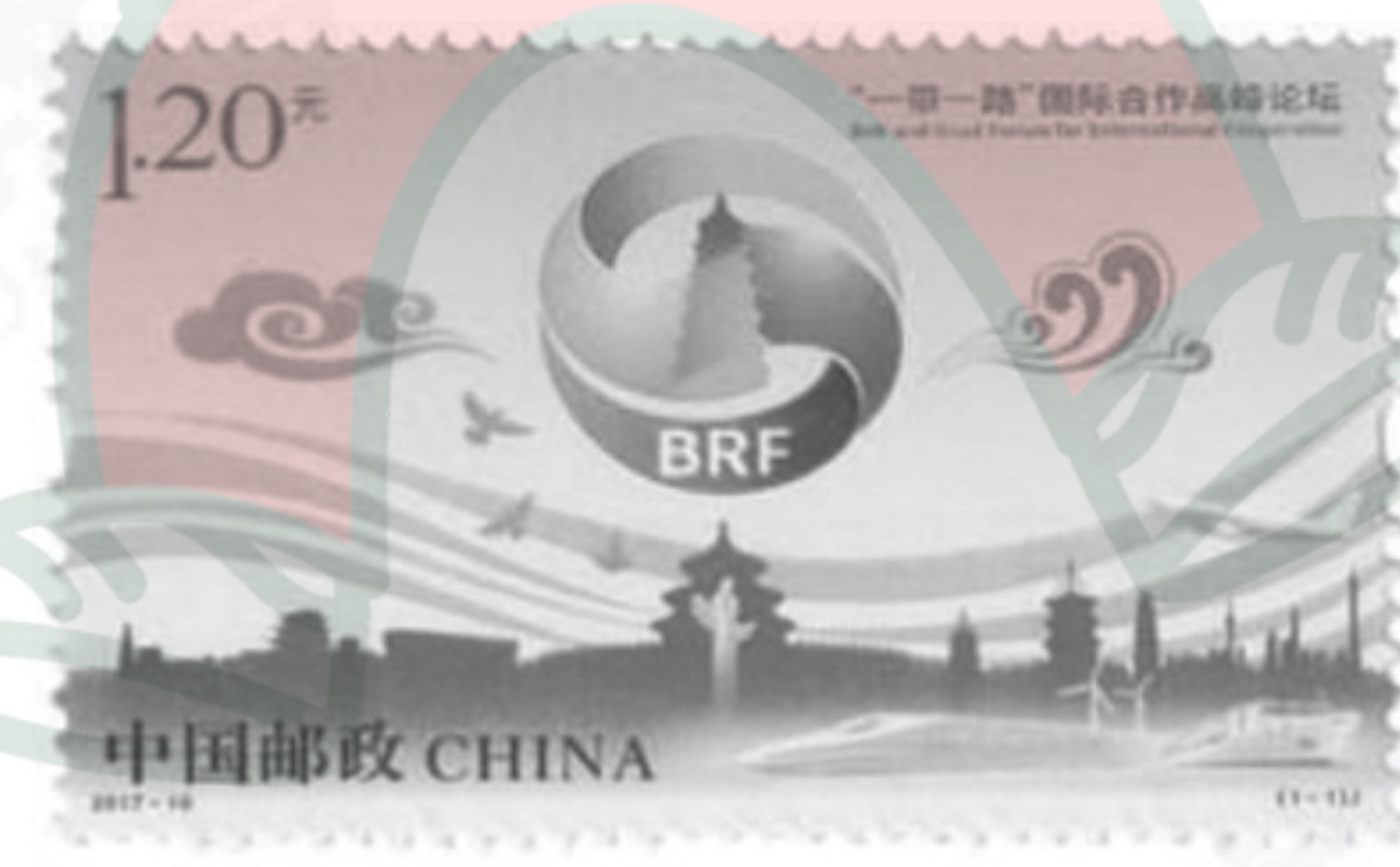
图四 《“一带一路”国际合作高峰论坛》纪念邮票