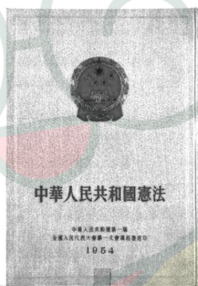
图二 1954年《中华人民共和国宪法》

(3)【国际合作】国际合作是社会进步的助推器。结合史实,分别简述国家邮政总局发行下面两枚纪念邮票的理由。(4分)